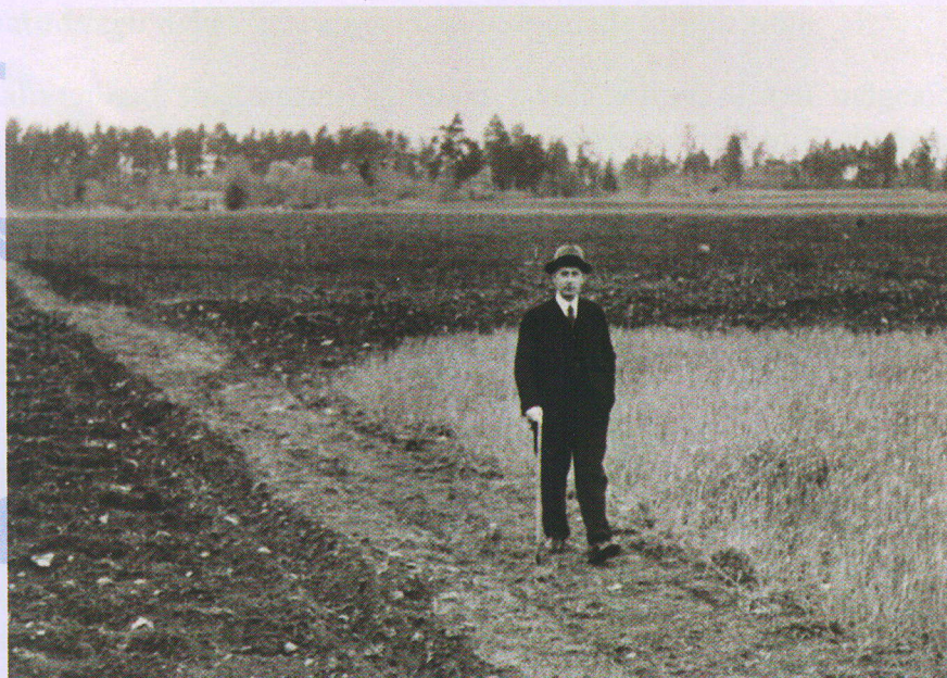
Kaarel Eenpalu oma Hellema talu põldudel